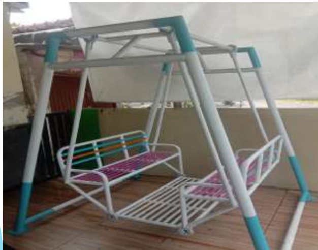
Ruang bermain anak