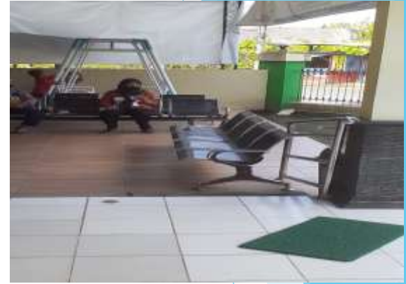
Sarana bagi disabilitas